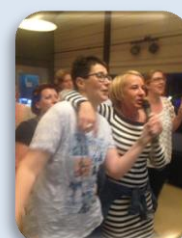
Enkele foto's van de gezellige en leuke feestavond!!